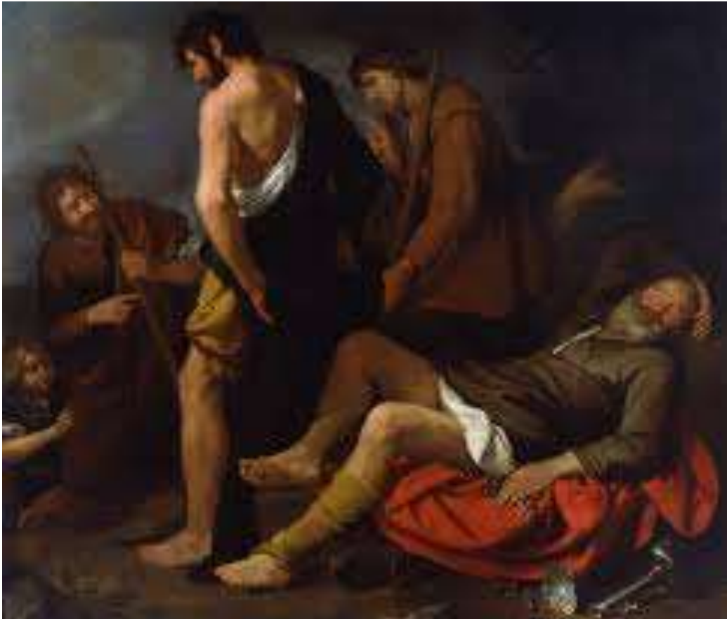
Ebbrezza di Noè di Giovanni Andrea De Ferrari.

Alla lettera: E Sem e Iafet presero ciò che vi è a sinistra e lo tennero in alto, per proteggere le spalle a entrambi, e coprirono, con la razionalità, la verità.